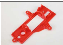
Bancada en línea NSR Ref. 1221 (rojo) Homologada para el Mosler MT900 de NSR