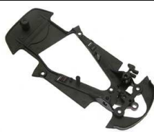
Porsche 977 – NSR REF 1375