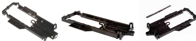
Avant-Slot – REF, 20502, 20504, 20507

Los chasis de la marca Avant Slot, podrán montar tornillos de nylon en sus laterales para poder graduar la basculación de la carrocería.