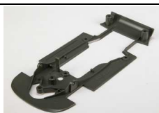
Mosler MT 900 – NSR REF 1309 (Color Negro)