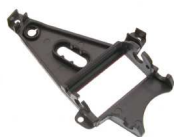
Bancada anglwinder NSR Ref. 1237 (violeta) Homologada para Porsche 977 y Corvette C6R