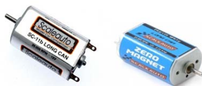
Motores homologados: Motor Scaleauto SC-11B Motor SC-31 Zero Magnet (Copa GT2)

Los motores serán entregados por la organización mediante sorteo. Una vez finalizada la prueba los equipos devolverán a la Coordinadora dichos motores para poder ser utilizados en las siguientes carreras. El campeonato se iniciará con motores nuevos y estos se rotarán las primeras pruebas hasta haberlos utilizado al menos una vez.